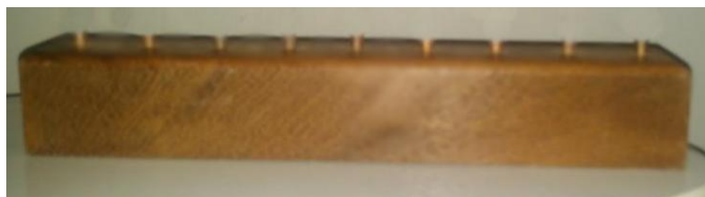
Figura 1: Base de madeira