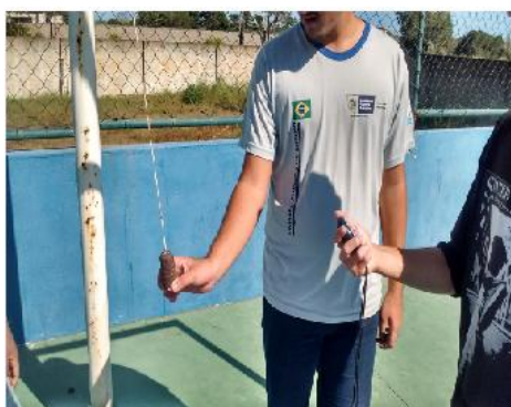
Figura 3: Deslocamento lateral do pêndulo simples.

Os grupos podem ser divididos com no máximo 5 alunos. Um dos integrantes do grupo ficará responsável pelo deslocamento lateral do peso do prumo vide figura 3 (parte metálica), um segundo integrante medirá horizontalmente a distância deslocada a fim de garantir sempre a mesma amplitude de oscilação, e um terceiro aluno, de posse do cronômetro, fará a medição do período após cinco oscilações, e os demais componentes devem observar atentamente o experimento, intervindo caso detectem algo errado. Após anotar os dados fornecidos em uma tabela, montarão no histograma as frequências achadas em hastes diferentes, onde cada dado distinto equivale a um bloco numa haste diferente.