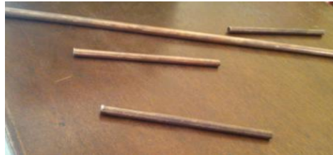
Figura 2: Hastes

bordas recém serradas devem ser esmerilhadas a fim de eliminar arestas cortantes e pontiagudas e desta forma permitir o encaixe nos furos da base. Em seguida, coloca-se cola em cada furo da base e encaixam-se as hastes neles. Ficando 13,5 cm de haste acima da superfície superior do histograma.