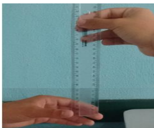
Figura 2: tempo de reação método II

Em relação ao método II, um aluno deverá posicionar uma régua de 30 cm na posição vertical, outro estudante deve se posicionar em frente a esse e, sem avisar, o primeiro aluno deverá soltar a régua. Assim, por reação, o segundo aluno percebendo que a régua está em queda livre fará um movimento em pinça com o dedo indicador e o polegar para segurar a régua conforme figura 2. Em cada queda da régua serão anotadas as distâncias percorridas pela mesma, e em seguida serão calculados o tempo a partir da utilização da equação de queda livre, (que será disponibilizada no quadro). O evento precisará ser repetido pelo número de vezes definido para o método I, de forma que possam ser comparados.