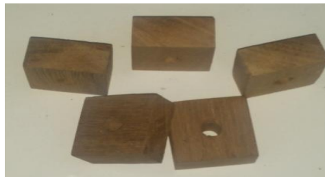
Figura 3: Blocos perfurados